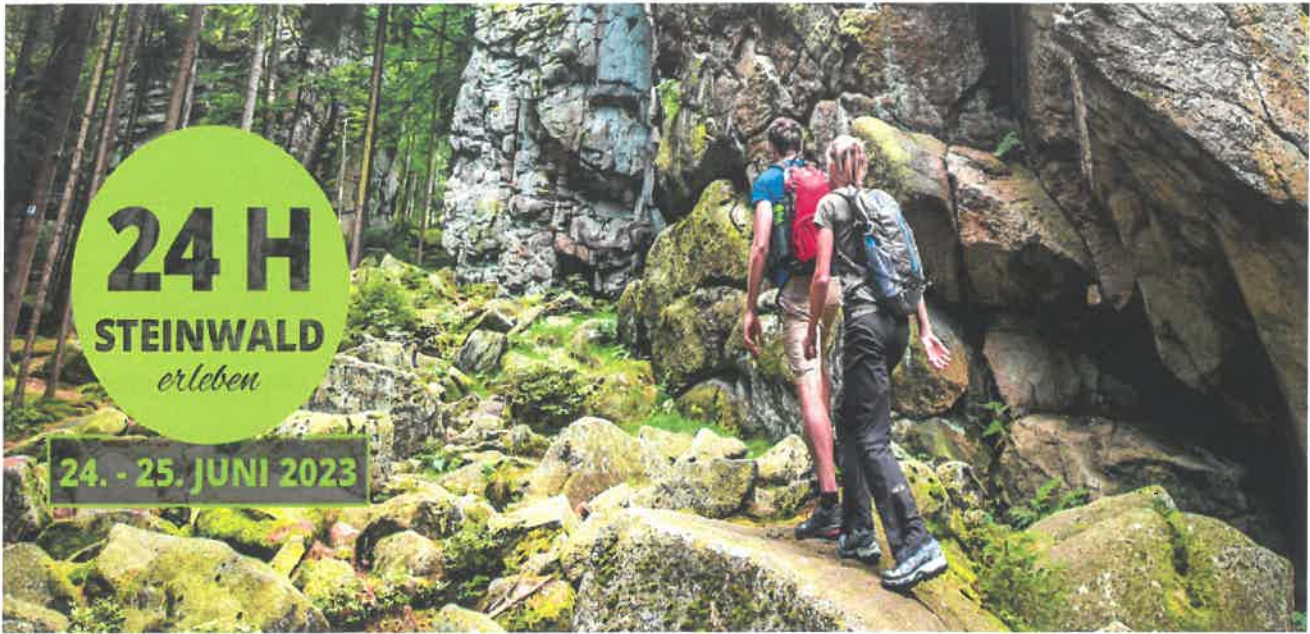
Banner von 24 Stunden Steinwald erleben

24 Stunden Steinwald erleben steht für ein abenteuerreiches Wochenende mit viel Bewegung in der Natur. Verschiedene Gästeführer führen am Wochenende des 24. und 25. Juni 2023 zu den schönsten Ecken im Naturpark und plaudern dabei aus dem Nähkästchen. Beim Wandern und Radfahren werden verborgene Schätze in der Natur oder geologische Besonderheiten erkundet. Ganz nach persönlichem Geschmack kannst du dir deine eigenen, erlebnisreichen Stunden im Steinwald gestalten und den Facettenreichtum des zweitkleinsten Naturparks in Bayern kennenlernen.